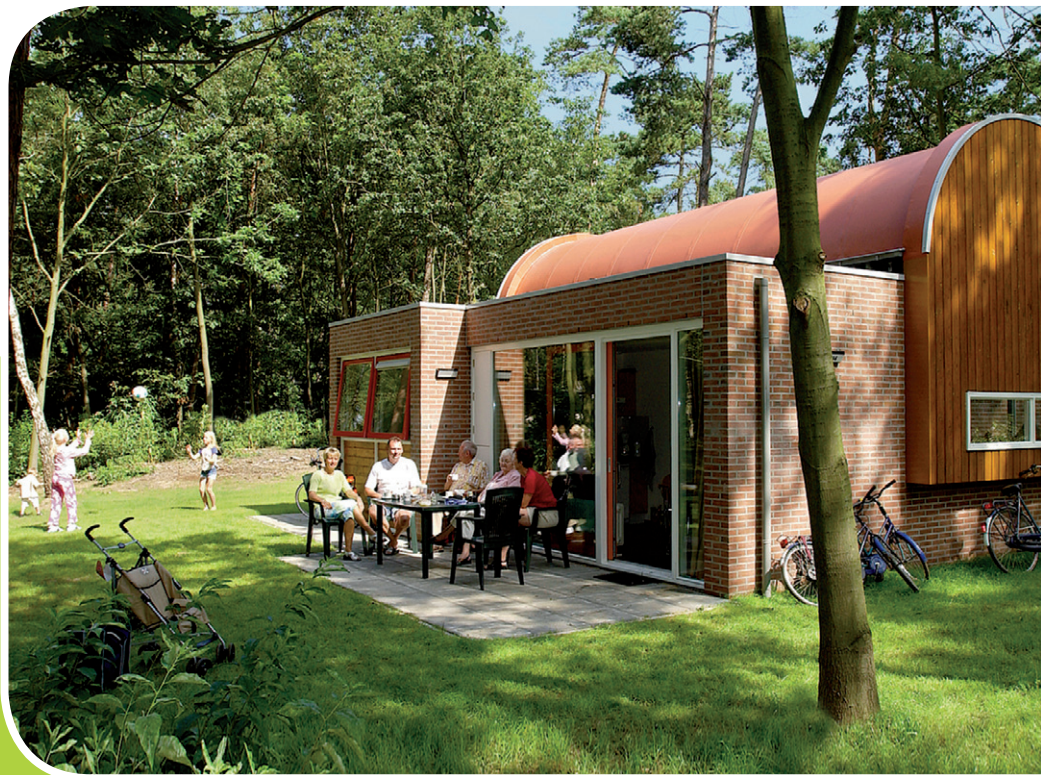
RCN het Grote Bos, Doorn

Boek nu uw zorgeloze vakantie en kijk op www.zorgeloosweg.nl of bel 06 - 812 39 423