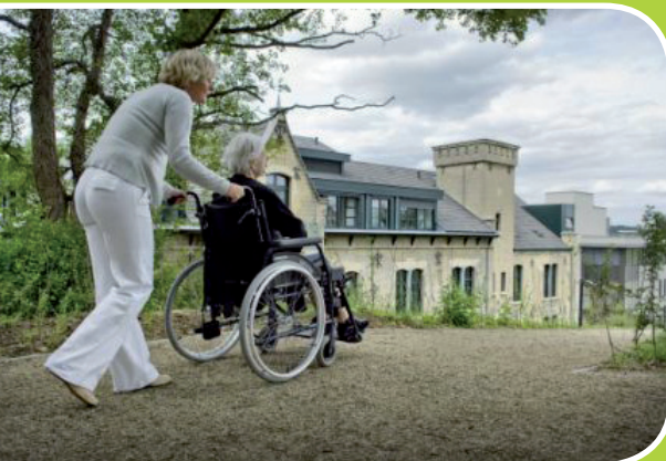
ECR Domaine Cauberg, Valkenburg aan den Geul

Wilt u zonder zorgen lekker op vakantie in Nederland? Boek dan uw vakantie bij Zorgeloosweg.nl