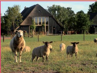
De Koekoeksklok, Beilen (voorbeeld van een verzorgende accommodatie)