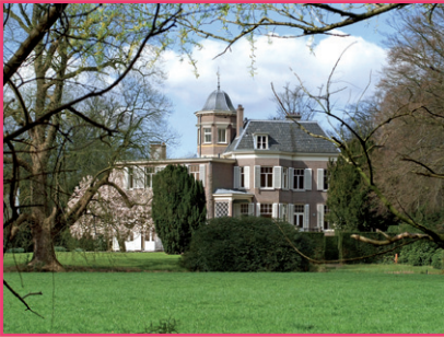
Zorghotel Residentie Jaglust, 's-Graveland (voorbeeld van een zorghotel)

U wilt graag op vakantie en heeft behoefte aan zorg op uw vakantieadres? Zorgeloosweg.nl regelt alles voor u. Hieronder vindt u een overzicht van mogelijke accommodaties.