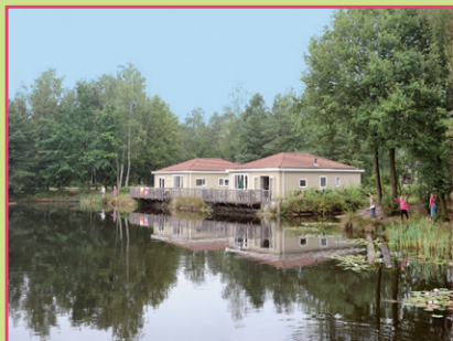
RCN de Flaasbloem, Chaam (voorbeeld van een bungalowpark)